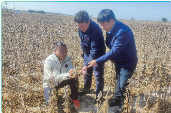
田间实测“东生118”大豆在盐碱地产量表现