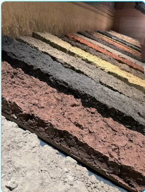
中国生态系统研究网络 (CERN) 野外台站的土壤标本

大型土壤沙盘、飞屏互动系统与地带性土壤标本，直观呈现我国土壤分布规律。标本厅为核心展区，中国标本区集中展陈不同土壤带的典型标本及形态标本；全球土壤、古水稻土、中国生态系统研究网络 (CERN) 土壤、月壤等专题区，借助视频、互动及场景模拟，阐释全球土壤资源特性，激发星际土壤探索兴趣。科普厅以“土壤探索之旅”为主线，通过启程、沃土行、净土行、活土行、厚土行等五大趣味板块，生动解读土壤与农业、生态、环境及文化的紧密关联。成果厅聚焦土壤学领域重大科研成果与杰出科学家风采，重点介绍 2026 年首次在华举办的第 23 届世界土壤学大会，彰显我国土壤科学的深厚积淀与国际影响力。