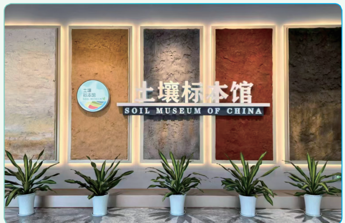
土壤标本馆正门大厅