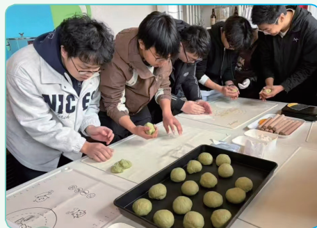
师生参与面包制作

3 月 14 日，国科大现代农学院和本科部的 30 名师生在博士农场（北房基地）举办了一场“春启‘心’程，播撒希望”的主题活动。在烘焙师傅的指导下，大家实践了窑烤面包制作过程，于麦香烟火间，体味生活本真。随后，大家走进田间，在农技师的帮助下，播种豌豆，体验农事劳动。本次活动引导师生厚植劳动情怀、涵养积极心态，以昂扬姿态奔赴成长新程。