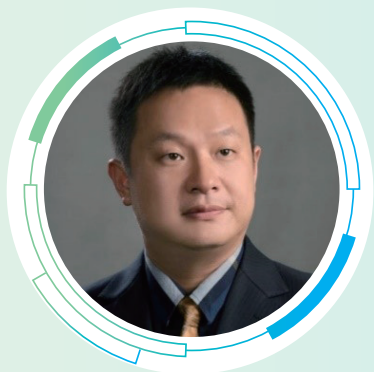
朱春梧 研究员 南京土壤研究所

朱春梧研究员长期深耕农田应对气候变化研究，取得了一系列具有重要国际影响的科研成果。面向国家重大战略与全球可持续发展需求，他带领团队系统研究大气 CO 2 浓度升高对全球粮食产量、品质及土壤肥力可持续性的影响。针对前两代全球 FACE 平台在模拟气候因子互作方面的局限，他创新性地提出科学构想，牵头设计并建成第三代 FACE 平台，在国际上率先实现开放式条件下 CO 2 浓度升高与全生态系统温度升高的耦合模拟。目前，该平台已成为支撑国内外 40 余家顶尖科研团队开展前沿研究的重要设施，为我国凝聚了一支高水平的国际化队伍，有力引领了领域发展。朱春梧研究员以第一或通讯作者在 Nature Geoscience、Nature Food、The Lancet Planetary Health、Science Advances 等国际顶级期刊发表研究论文 40 余篇，其成果被 IPCC、FAO、WHO 等国际权威组织采纳 20 余次，为全球气候治理与粮食安全政策制定提供了关键科学依据，显著提升了我国在该领域的国际影响力与话语权。